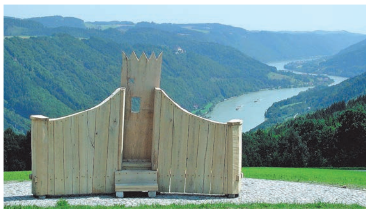
Die Sauwald Panoramastraße soll attraktiviert werden.

Der bestehende, rund 3,5 Kilometer lange ‚Waldlehrpfad ‚Waldschule Esternberg‘ wurde vom ehemaligen Volksschul-Direktor